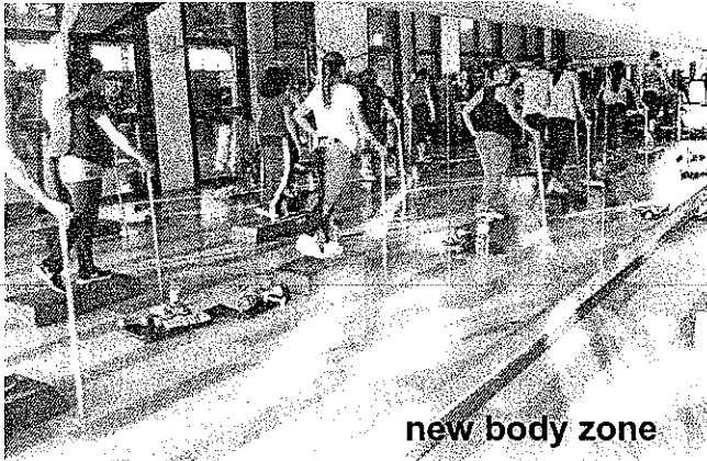
new body zone